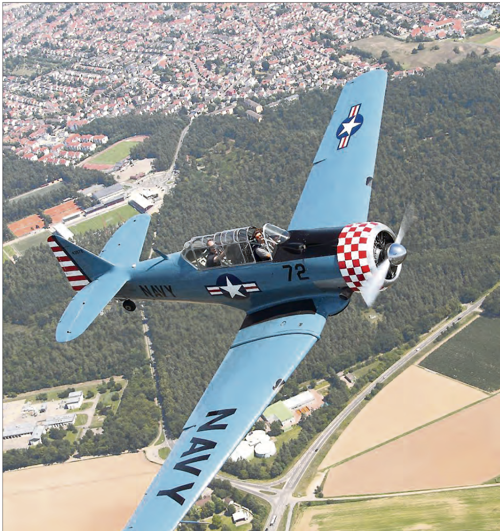
Die Weinheimer Segelflieger sorgen am 2. und 3. September für besondere Szenen in der Luft.