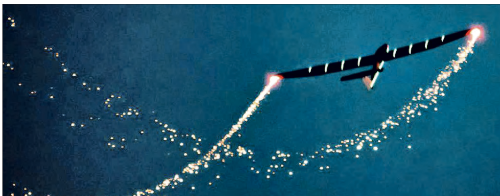
Eines der Fest-Highlights ist ein Dämmerungskunstflug mit der beleuchteten B4 mit Pyro-Effekten.

Ein professionelles Feuerwerk bildet den krönenden Abschluss des Sommerfest-Programms am 3. September..