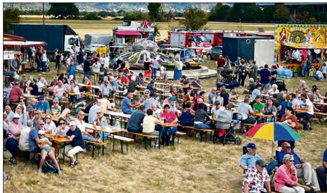
Das traditionelle Sommerfest der Segelflieger erfreut sich Jahr für Jahr großer Beliebtheit.