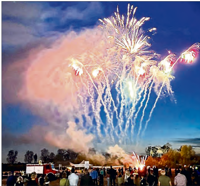
Ein professionelles Feuerwerk bildet den krönenden Abschluss des Sommerfest-Programms.